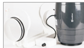
Zastosowanie w instalacji nawiewnych i wyciągowych biur, mieszkań, sklepów, lokali gastronomicznych itp.

Wentylatory kanałowe TNT SILENT przeznaczone do wentylacji pomieszczeń o niskim stopniu zapylenia. Idealnie nadają się do instalacji nawiewnych i wyciągowych biur, mieszkań, sklepów, lokali gastronomicznych itp.