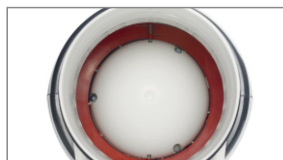
Zakres temperatury pracy: -20°C~60°C.