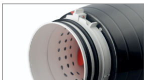
Zwarta budowa wentylatora