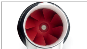
Wykonanie z wysokiej jakości tworzywa sztucznego